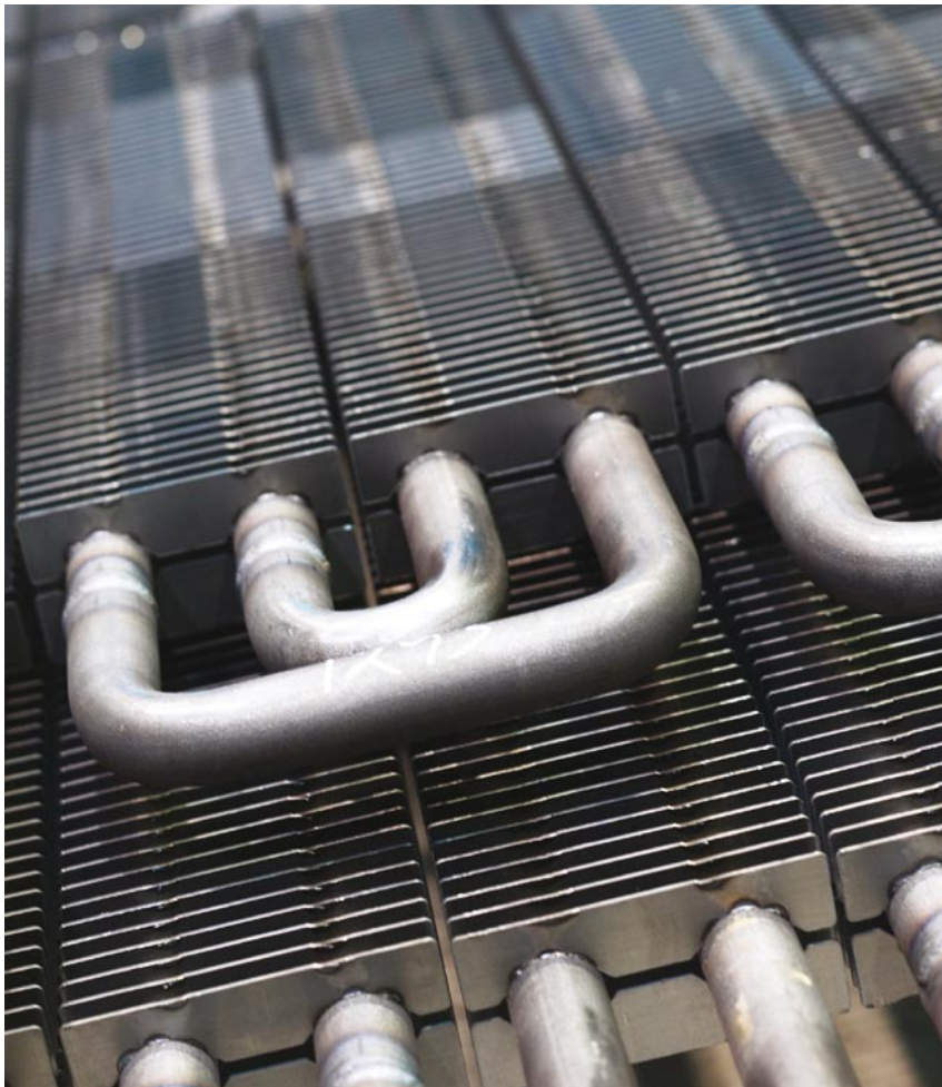
MISSONTM XW型废气经济器所采用的高效双翅片管

80千瓦)。在某些情况下，建议在辅机上安装废气经济器，以便在停靠港口期间，借助电热器生成蒸汽，满足需要。